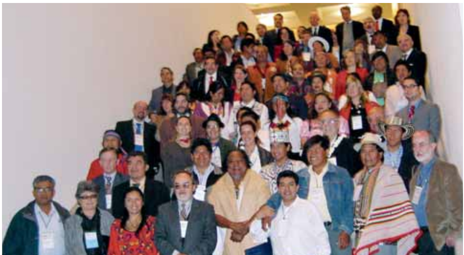
Foto de grupo de los asistentes a la VIII Asamblea General del Fondo Indígena realizada en noviembre del 2008 en la ciudad de México.

Con el desarrollo de estos programas se busca hacer del Fondo Indígena un organismo internacional de derecho público consolidado, descentralizado, sostenible técnica, financiera e institucionalmente, a fin de promover el fortalecimiento y desarrollo político, económico, cultural, espiritual y social de los pueblos, comunidades y organizaciones indígenas de