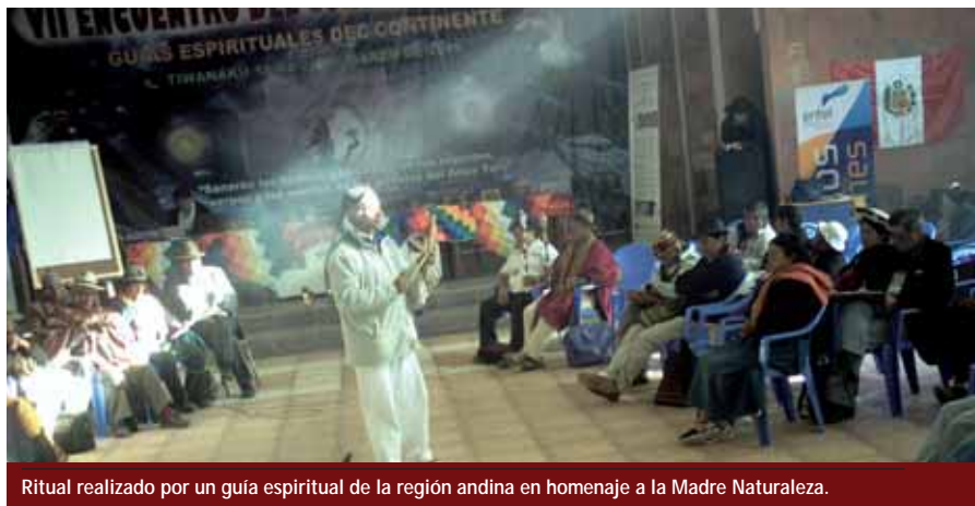
Ritual realizado por un guía espiritual de la región andina en homenaje a la Madre Naturaleza.