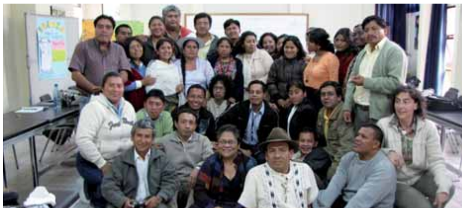
El alumnado de la tercera promoción del curso de EIB en una foto de grupo junto a profesores de la Cátedra Indígena Itinerante y personal de la GTZ.