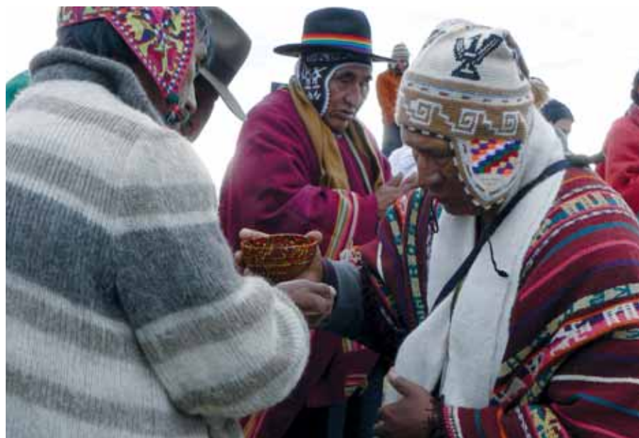
Los conocimientos tradicionales indígenas son un patrimonio colectivo de las comunidades.

Específicamente en el marco del Proyecto de Fortalecimiento de la Sociedad Civil (SOCICAN), y en acompañamiento al Consejo Consultivo Indígena de la Comunidad Andina de Naciones (CCICAN) y la Coordinadora de Organizaciones Indígenas Campesinas y Comunidades Interculturales de Bolivia (COINCABOL), se está poniendo en marcha la tarea de “consensuar una propuesta de observatorio de los Pueblos Indígenas Originarios, Campesinos y Comunidades Interculturales sobre la Propiedad Intelectual y Conocimientos