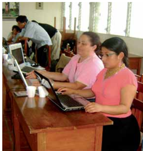
El Fondo Indígena utiliza las TIC para contribuir al desarrollo con identidad de los Pueblos Indígenas de la región.

El Sistema de Monitoreo y Seguimiento de la UII nace de la necesidad de generar un banco de datos del alumnado que cursa los postgrados, de los estudiantes egresados, de organizaciones indígenas que avalan a los postulantes y becarios, de los profesores de las universidades asociadas... Estas y otras inquietudes han motivado este proyecto, que sin duda alguna facilitará la visibilización de los resultados e impactos de la UII.