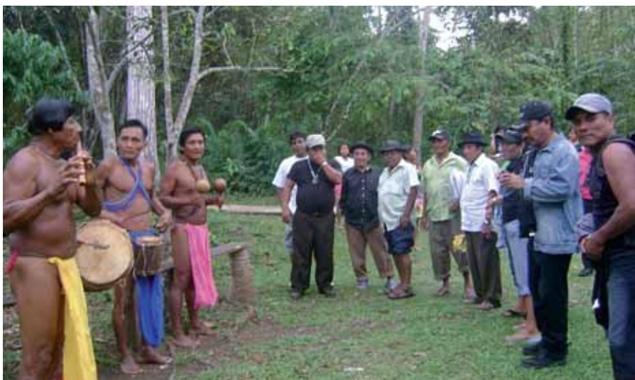
El Programa Emblemático de Desarrollo con Identidad fortalece la gestión del autodesarrollo en América Latina y El Caribe a través de plataformas subregionales. En la foto: reunión celebrada en Panamá en el marco de este programa.

Estas nuevas iniciativas se vinculan con el Programa Regional de Desarrollo con Identidad a través del Proyecto “Apoyo al Programa de Desarrollo con Identidad Enfocado al Vivir Bien/Buen Vivir Comunitario de los Pueblos Indígenas de América Latina y El Caribe”, que tiene como objetivo articular cuatro plataformas subregionales (centroamericana, andina,