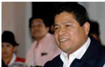
La VIII Asamblea General eligió por unanimidad a Luis Évelis Andrade como Presidente del Fondo Indígena.

En el año 2004, en el VI Congreso Nacional de los Indígenas de su país, fue elegido Presidente de la Organización Nacional de Indígenas de Colombia (ONIC). Posteriormente, en diciembre de 2008, debido a su positiva gestión fue reelegido como Consejero Mayor de la ONIC para el período 2008-2012.