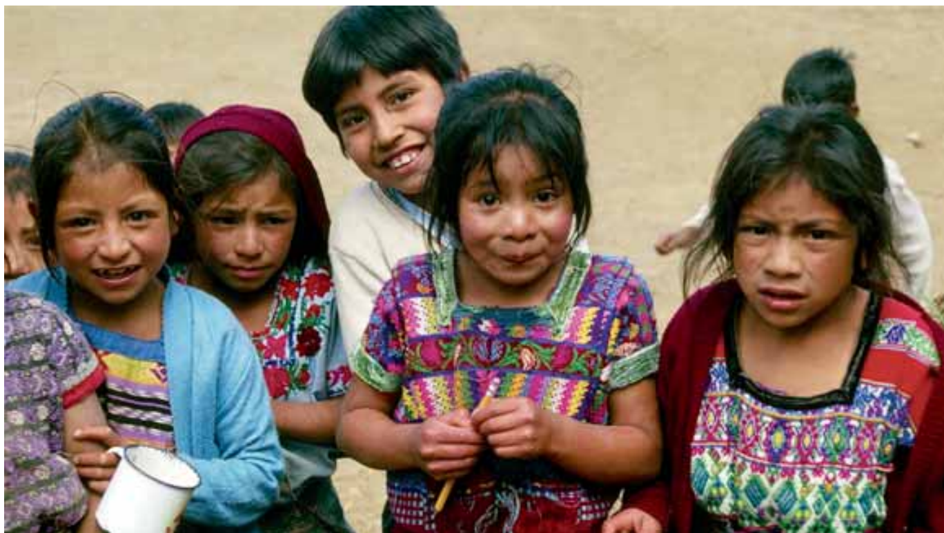
La niñez indígena es la más vulnerable ante las peores formas de trabajo infantil.

Cerca de 17 millones de niños y niñas entre 5 y 17 años de edad en América Latina no están gozando de su infancia ni del desarrollo de sus facultades físicas y mentales, al estar atrapados en situaciones de trabajo infantil por abolir.