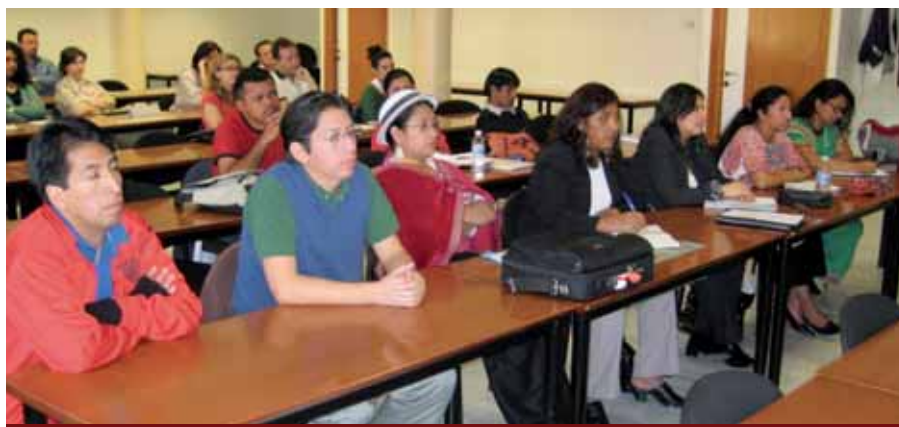
Becarios de la tercera versión del curso de Madrid reciben sus primeras sesiones educativas.