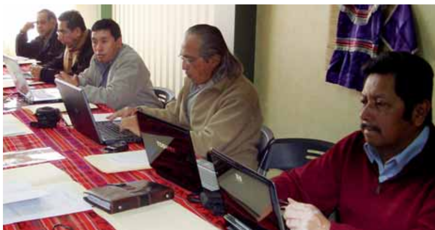
Los líderes indígenas de la región acordaron la implementación de un proceso de unidad y emitieron la declaración “Diálogo de Alternativas y Alianzas de los Movimientos Indígenas, Campesinos y Sociales de Abya Yala”.

Se hizo hincapié en las actuales crisis mundiales (financiera, climática, energética,