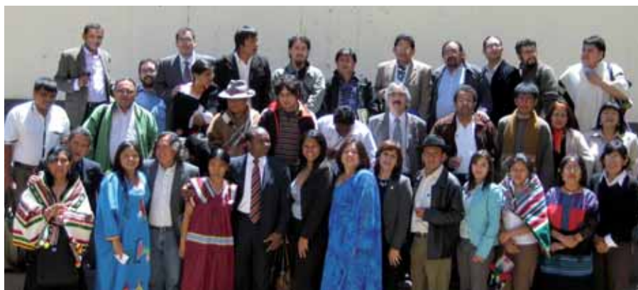
El 17 de noviembre de 2008, los alumnos de la segunda promoción del Diplomado en Derechos Indígenas iniciaron sus clases.

El Diplomado en Derechos Indígenas, que tiene como sede al Instituto de Estudios Indígenas de la Universidad de la Frontera (UFRO), inició sus clases el 17 de noviembre de 2008 y concluirá el 25 de septiembre de 2009. En esta segunda versión, 2008-2009, se presenta la novedad de brindar un módulo electivo que permite al alumnado optar entre dos menciones: Mención en Estados Plurinacionales y en Procesos Autonómicos o Mención en Derechos de la Infancia y Adolescencia Indígenas.