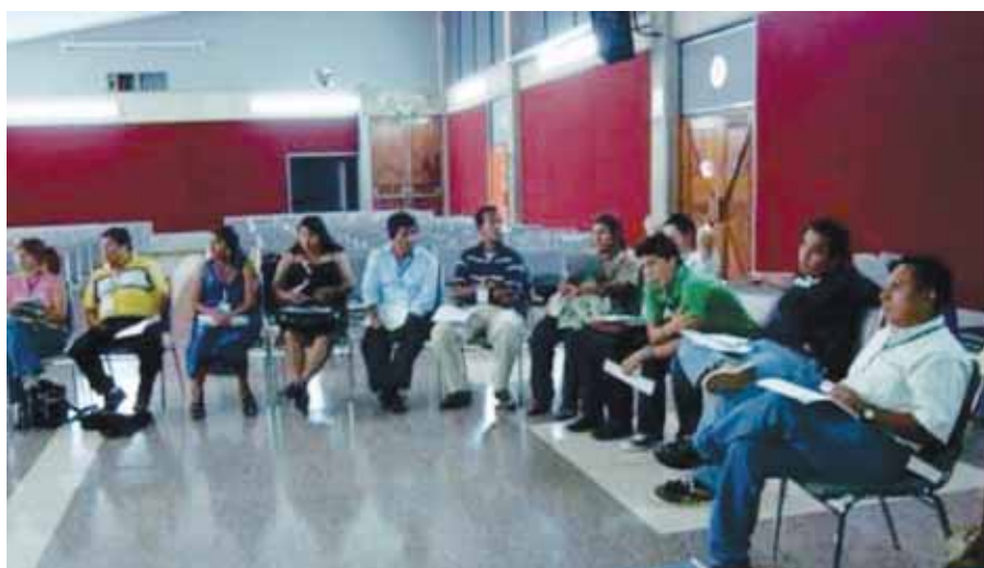
Estudiantes del Segundo Curso Internacional para Líderes Indígenas de Centro América sobre Gobernabilidad y Políticas Públicas desde la Cosmovisión Indígena.

La formación que los 18 líderes indígenas de Guatemala, Honduras, El Salvador, Costa Rica Nicaragua y Panamá reciben con este curso deja constancia del impacto de la misma, en la mediación y gestión técnica de temas que son de interés de los Pueblos Indígenas como los derechos colectivos e individuales de los Pueblos Indígenas, especialmente el derecho a sus tierras y territorios, bienes, empleo, salud, educación y a determinar libremente su condición política y su desarrollo económico. ■