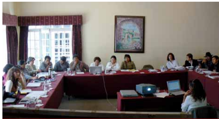
Jornada de trabajo durante el taller de censos de la ronda 2010 realizado en marzo del presente año.

Con base en los resultados obtenidos en el IX Encuentro Internacional de Estadísticas de Género, Ronda Censal 2010 (Aguascalientes, México, septiembre 2008), el Seminario-taller “Censos 2010 y la inclusión del enfoque étnico. Hacia una construcción participativa con Pueblos Indígenas y afrodescendientes de América Latina” (Comisión Económica para América Latina y el Caribe [CEPAL], Santiago de Chile, noviembre, 2008), y las experiencias nacionales presentadas durante