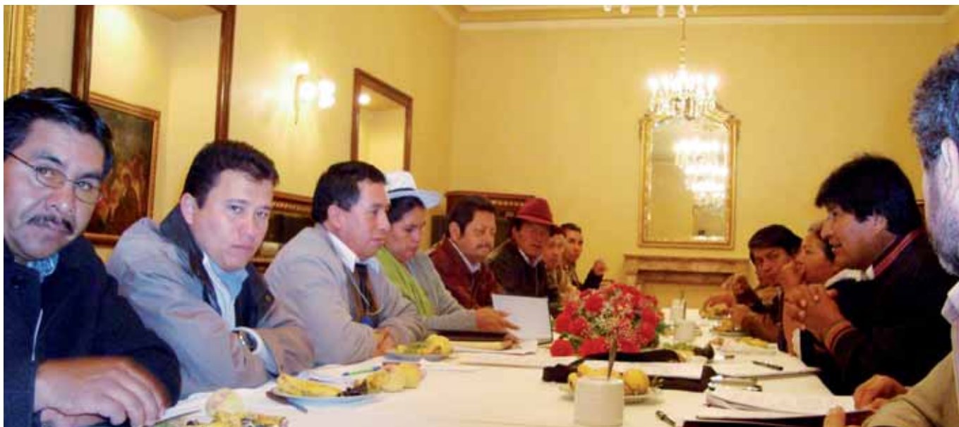
Los representantes de las organizaciones sociales mantuvieron una reunión con Evo Morales, Presidente de la República de Bolivia.