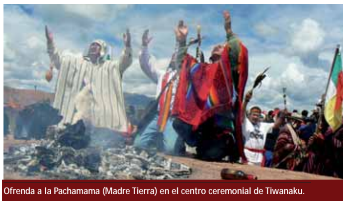
Ofrenda a la Pachamama (Madre Tierra) en el centro ceremonial de Tiwanaku.

Asimismo, un punto esencial del evento fue la conformación del Consejo Originario Continental de Guías Espirituales.