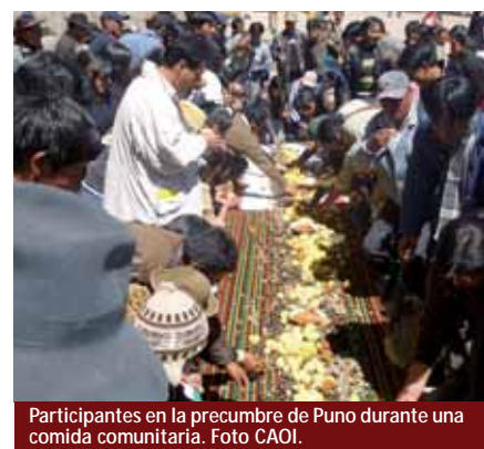
Participantes en la precumbre de Puno durante una comida comunitaria.

El II Encuentro de Niñez y Juventud Indígenas, por su parte, busca “promover