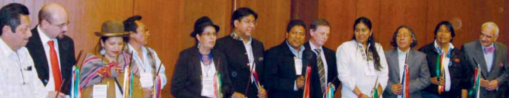
Nuevas autoridades del Fondo Indígena, elegidas durante la VIII Asamblea General, durante el acto de posicionamiento.

La VIII Asamblea General del Fondo Indígena eligió a las nuevas autoridades del Consejo Directivo, encomendándoles la conducción del organismo por el período 2008-2010. Asimismo, eligió al nuevo Comité Ejecutivo, el cual se integra con las siguientes personas: