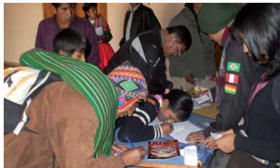
Las organizaciones indígenas del continente ultiman los preparativos para la IV Cumbre de Pueblos y Nacionalidades y realizan encuentros previos en cada país. Inscripción de asistentes en el encuentro preparatorio realizado en Puno.

Para alcanzar estos objetivos, se ha optado por una metodología de trabajo en distintas mesas y comisiones. Se han definido 14 ejes temáticos, uno por mesa, cada uno de los cuales