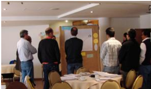
Participantes en el Taller.

Específicamente, el taller permitirá a los participantes: interrelacionar el Cambio Climático con el proceso de planificación del desarrollo, familiarizarse con el uso de información climática y fuentes de datos e identificar y definir, a través de cinco módulos, opciones concretas de adaptación a niveles nacional, sectorial, local y de proyecto.