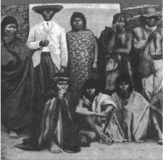
po de Tapari o Tapiete en Cabayu Iguá, Mchareti hacia 1900 (Chaco, 1900)