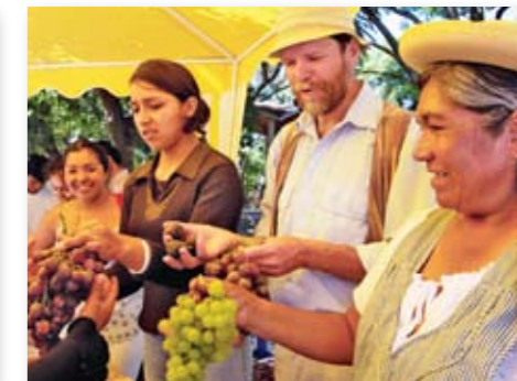
62 toneladas de uvas fueron producidas el 2005.