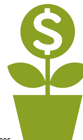
Fortalecimiento de las ANP como proveedoras de servicios ecosistémicos

Cabe mencionar que la creación o impulso de instrumentos de financiamiento a nivel individual de las ANP no es recomendable por la complejidad que implicaría su manejo. No obstante, existen muchas oportunidades que las ANP pueden aprovechar e impulsar mediante una negociación a nivel regional, usando los Enlaces Regionales sobre financiamiento.